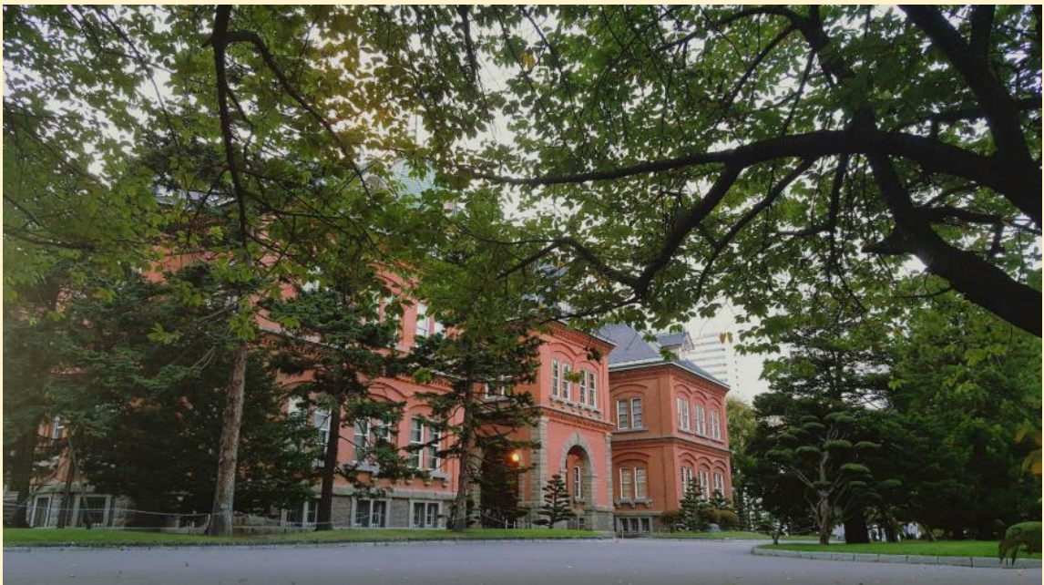
ที่ทำการรัฐบาลเก่า (Akarenga)