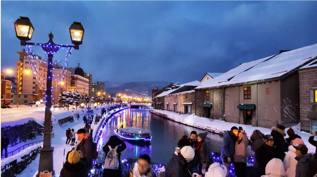
คลองโอดารุ