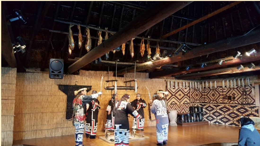
พิธีพืชมงคลไอนุ โนโบริเบทสึ