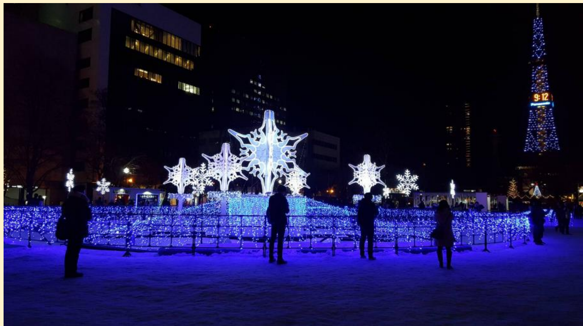
งาน Sapporo white illumination สวนโอไดริ