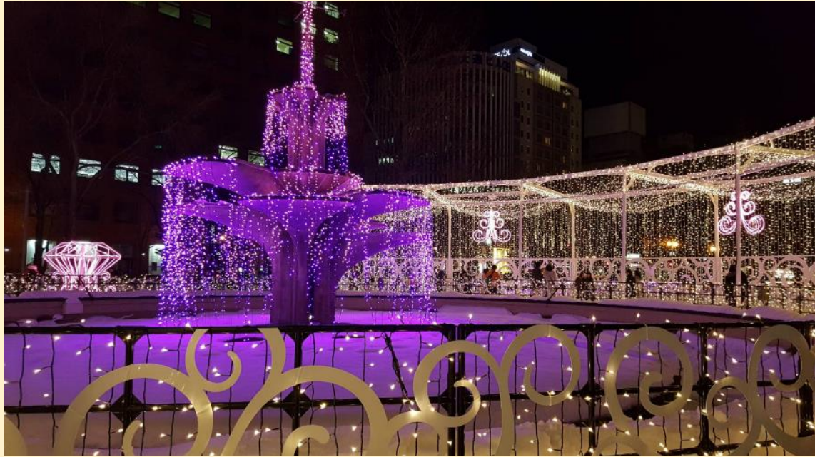
งาน Sapporo white illumination สวนโอโดริ