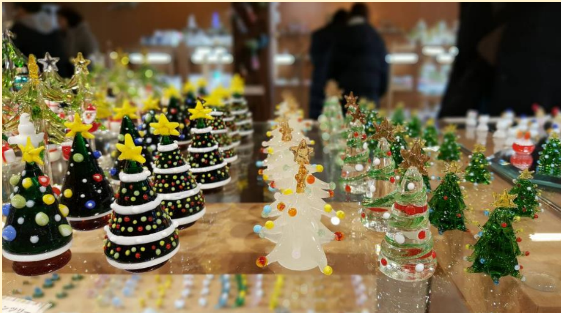
ร้านเครื่องแก้ว โอดารุ

ที่ฮอกไกโดยังมีอะไรน่าสนใจอีกเยอะจนเล่าไม่หมดเลยละ อยากให้น้อง ๆ มาเห็นเอง ยังงั้นก็ขอฟลากม.ฮอกไกโดได้ด้วยจ้า ใครมีข้อสงสัยอะไรก็ทักมาคุยกันได้นะ