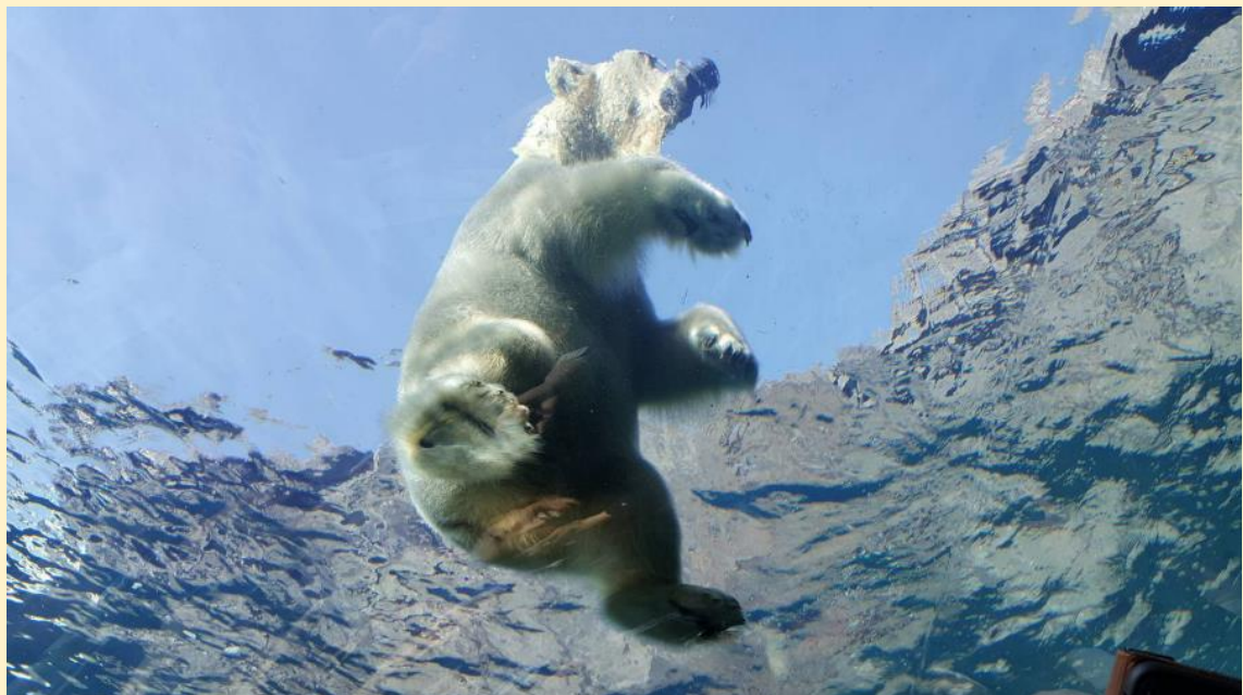
สวนสัตว์มารูยามะ ซัปโปโร