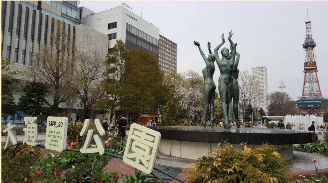
สวนโอไดริ