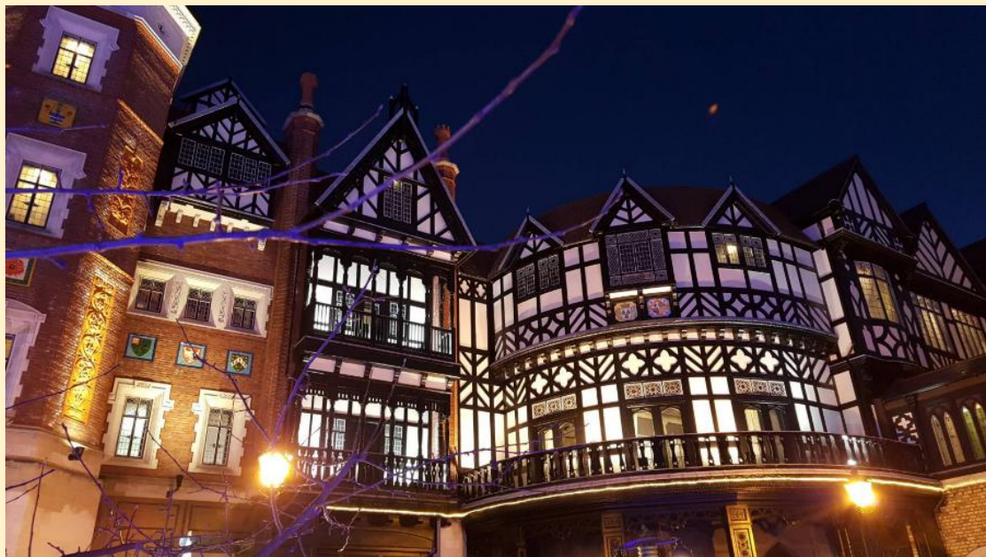
Chocolate Factory Sapporo