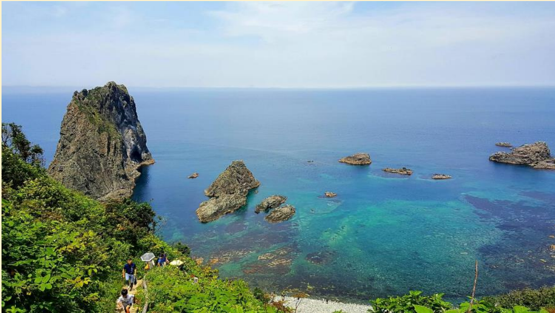
Shimamui coast-Shakotan Cape