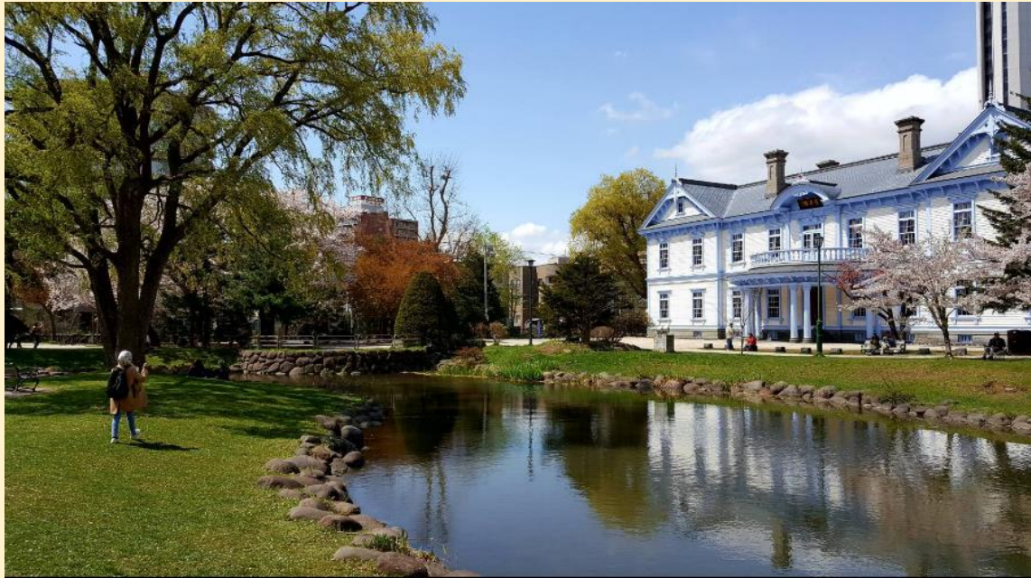
สวนสาธารณะนากาจิม่า ซัปโปโร