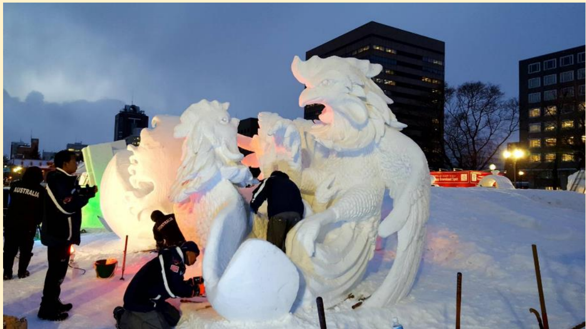
งานเทศกาลหิมะ สวนโอโดริ