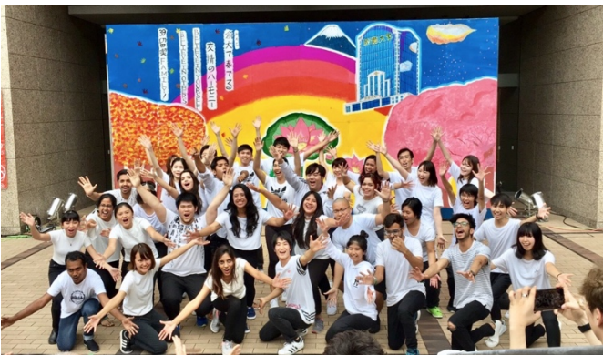
การแสดงเดินของ Oubaitori ที่งานเทศกาลของมหาวิทยาลัย

กิจกรรม : มีงาน 創大祭 ในเดือนตุลาคม จะมีการจัดกิจกรรมการเดินของมหาวิทยาลัย ชื่อ Key fest รวมนักเรียนต่างชาติทุกชาติ และ Oubaitori รวมประเทศในทวีปเอเชีย และเพื่อนชาวญี่ปุ่นเป็นผู้สอนเดิน