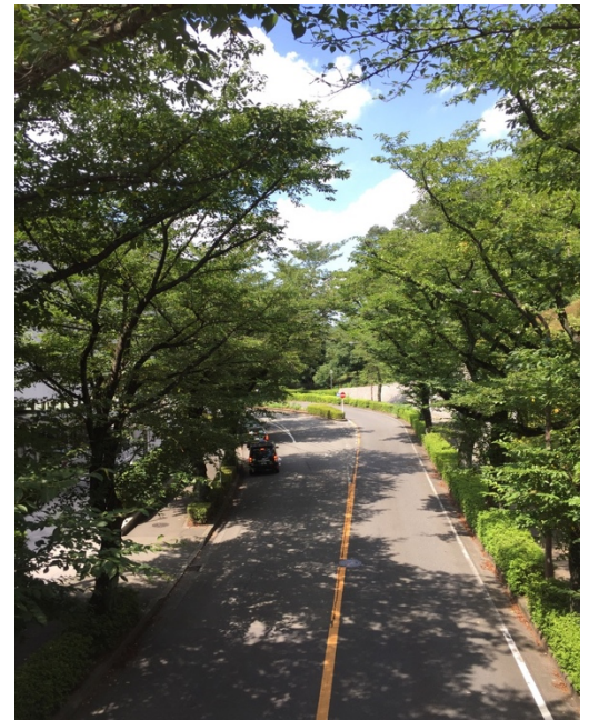
บริเวณด้านหน้าของมหาวิทยาลัย

การเดินทาง : เดินทางไปสถานีรถไฟ Hachioji (八王子) 20 นาที โดยรถบัสจากสถานี Babayatou (馬場野党) มี 2 สายที่ผ่านคือ รถบัสสาย 16 号 6 และ สาย 16 号 11 ราคาประมาณ 250 เยน แต่ถ้าหลัง 23.00 น. จะขึ้นเป็นราคา 500 เยน และมีรถบัสจากมหาวิทยาลัยไปชินจูกุในราคาประมาณ 470 เยน