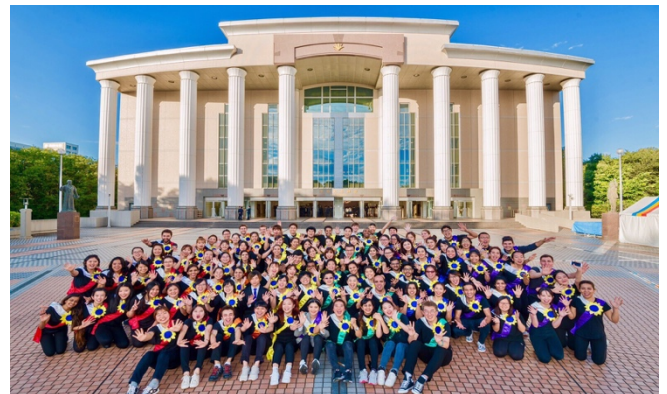
การแสดงเดินของ Key Fest ที่งานเทศกาลของมหาวิทยาลัย