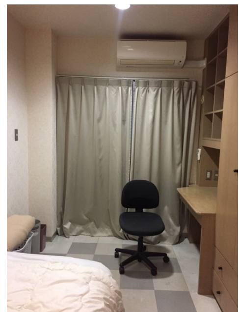
หอพักหญิง Cosmos

3. Hoyu Dormitory : หอชาย ห่างจากมหาวิทยาลัย 15 นาที (เดิน)