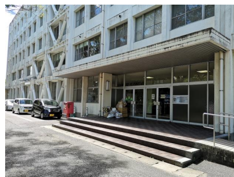
บรรยากาศภายในและภายนอกอาคารหมายเลข 2