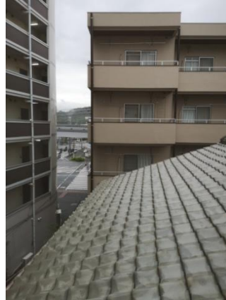
บรรยากาศภายในและภายนอกหอพัก