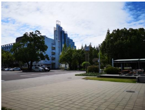
บรรยากาศภายในมหาวิทยาลัย

เป็นมหาวิทยาลัยประเภท Public University หรือมหาวิทยาลัยประจำเมือง (ไม่ใช่ National University หรือมหาวิทยาลัยของรัฐบาลกลาง) มีวิทยาเขตทั้งหมด 2 วิทยาเขต ได้แก่ วิทยาเขต Hibikino (ひびきのキャンパス) และวิทยาเขต Kitagata (北方キャンパス) นักศึกษาธรรมชาติที่ไปแลกเปลี่ยนผ่านโครงการของกองวิเทศสัมพันธ์ จะได้ไปเรียนที่วิทยาเขต Kitagata ซึ่งจะตั้งอยู่ที่เขต Kokuraminami (小倉南) เมือง Kitakyushu ภายในมหาวิทยาลัยพื้นที่ไม่ใหญ่มาก ธรรมชาติร่มรื่น มีบริการหลาย ๆ อย่างที่นักศึกษาแลกเปลี่ยนก็สามารถใช้งานได้ เช่น ห้องสมุดมหาวิทยาลัย มีชมรมมากมายไม่ว่าจะเป็นทางด้านกีฬา ด้านดนตรี และวัฒนธรรมญี่ปุ่น